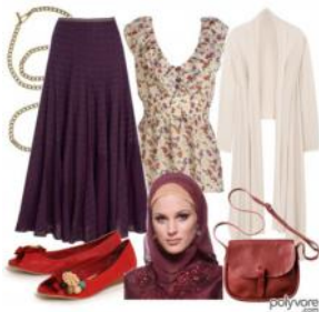
Imagen on line de cómo ponerse un al amira. Puede ser un ejemplo de que el pañuelo cada vez tiene más seguidoras, posiblemente en occidente quienes deciden llevarlo libremente y quizás no tengan en su entorno a quién preguntar sobre cómo colocárselo, de ahí que acudan a la Red. Existe un gran número de foros que dan consejos sobre el hiyab.

Tienda on line de ropa donde se puede adquirir tanto un hiyab como complementos de corte occidental. Lo que pone de manifiesto los elementos musulmanes y occidentales no están reñidos.